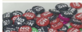
Schotten im Ausland bei Referendum außen vor